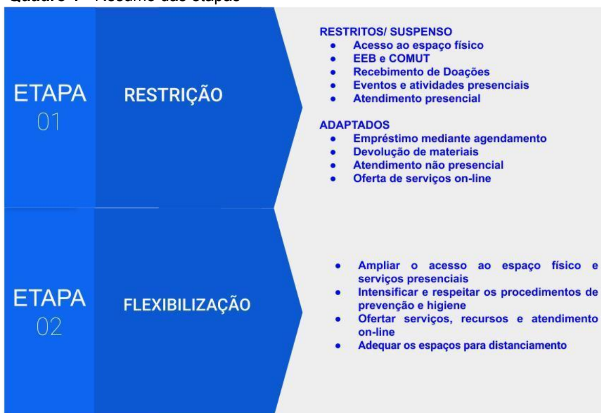
Quadro 1 - Resumo das etapas